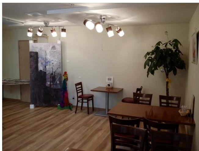
写真は喫茶ぽれぽれの内装（上）と外観（下）

また、隣にある喫茶ぽれぽれでは挽きたて珈琲や無添加国産小麦100%のパンやうどんパスタが楽しめます。お近くにお越しの際はぜひソネットと合わせてお立ち寄りください。